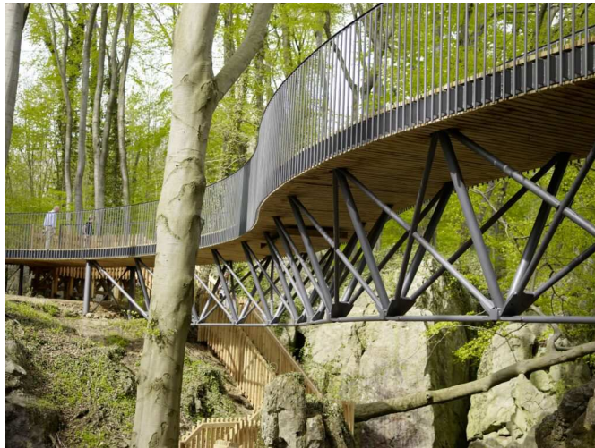
Neubau Fußgängerbrücke Felsenmeer in Hemer