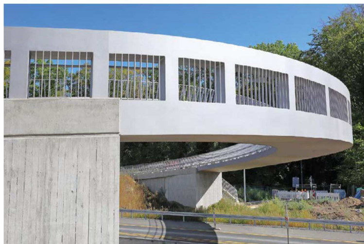
Ersatzneubau Brücke Freischütz , Schwerte