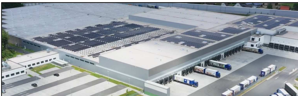
Brandschutzplanung Logistikzentrum Aldi Nord, Standort Nortorf (LPH 1-8 AHO, FLR, FWP)