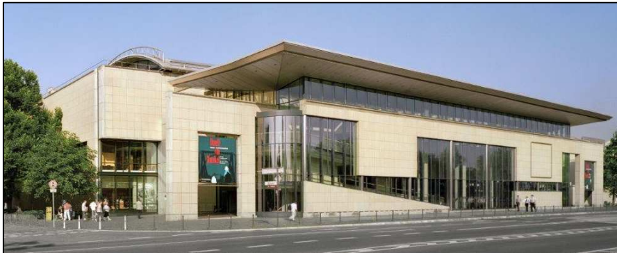
Brandschutzplanung Museum „Haus der Geschichte“, Bonn (LPH 1-8 AHO, FLR, FWP)