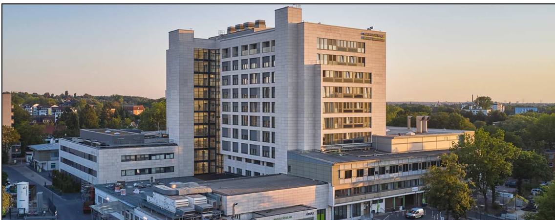
Brandschutzplanung Marien Hospital, Herne (LPH 1-8 AHO, FLR, FWP)